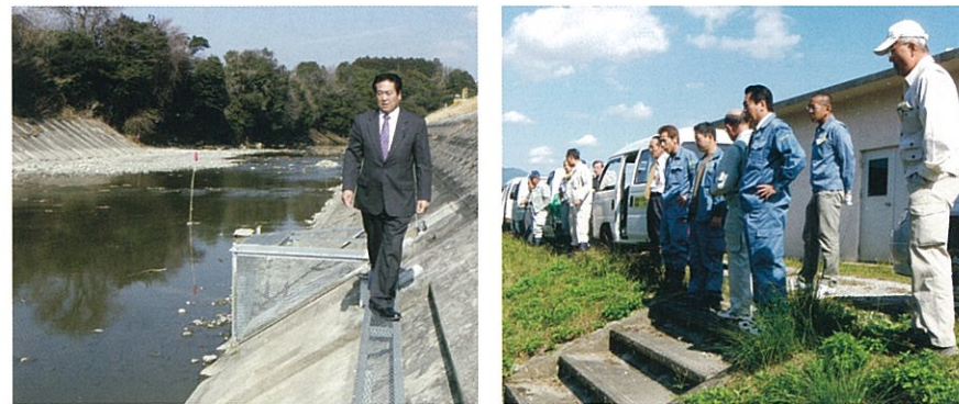
森町三井井堰上流土砂撤去現場を確認

香良洲橋改修に関連して、古川の河川改修事業を実施する事が 香良洲地区や雲出伊倉津地区の皆様の安全・安心を守る為には絶 対に必要な事業であります。