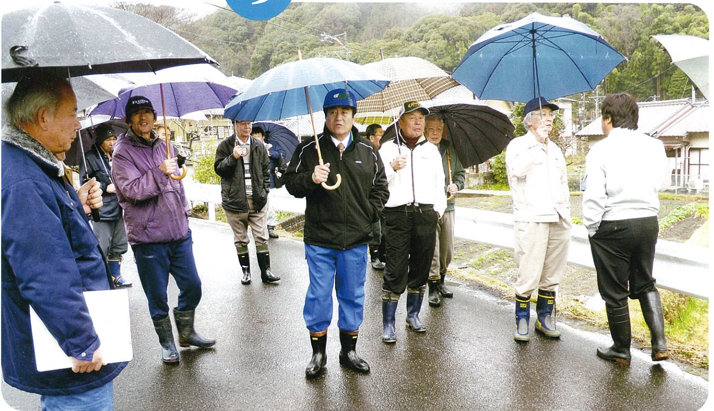
河川改修に地元・県・市の現場協議