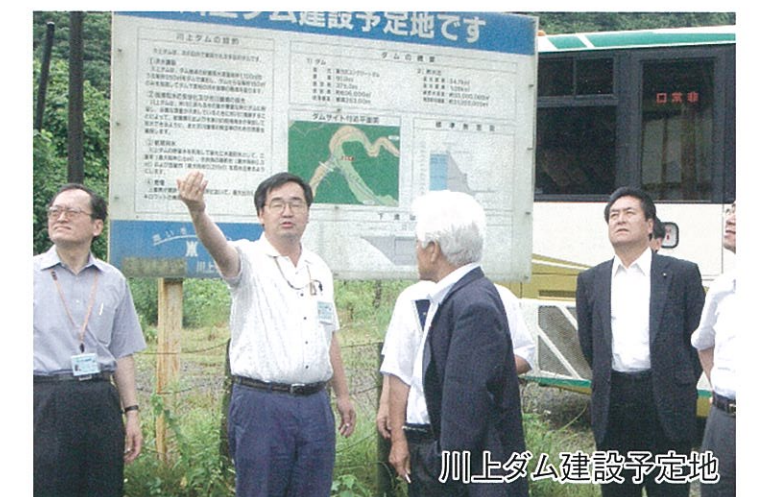
川上ダム建設予定地

道路整備15カ年計画の見直しや本年行われますしRDF処理料金の見直しや企業庁電気事業民営化の問題、伊賀水道・志摩水道の市への一元化等、課題が目白押しで、しっかり議論を深め最良の結果に結びつけるよう努力をしております。