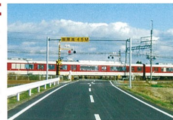
新家地区内近鉄踏切

近鉄名古屋線の交差する道路と踏切を新規に取り付けました。事故防止を図ると共に、地域住民の方への利便性アップに貢献しました。