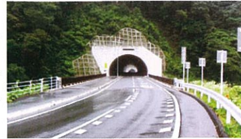
美杉町須淵トンネル

安全で便利なトンネルが開通しました。生活道路として、沢山の方に利用していただいています。