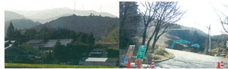
榊原温泉内道路拡幅工事

青山高原←→榊原温泉間道路の拡幅工事の実施。地域一体型の観光資源として、青山高原と榊原温泉間の道路を拡幅し、地域振興に役立つ道路となります。