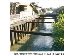
安濃町美濃屋川河川改修予定

相川などの河川改修が認められました。 相川・安濃川・岩田川・天神川・志登茂川を今後15年間で改修していく予定です。