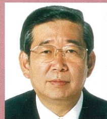
衆議院議員 前厚生労働大臣 川崎二郎