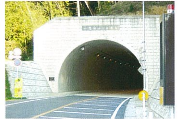
一志白山トンネル

一志白山トンネルが開通しました。安全で便利な生活道路として、たくさんの方に利用してもらえと思っています。