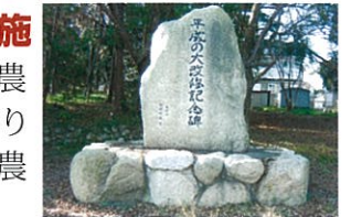
水分神社内記念碑

農地への水資源確保とともに、農業対策事業に取り組んでまいります。自然環境保護とあわせた農業政策の充実に行動します。