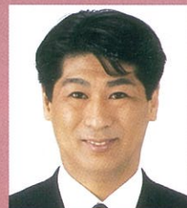
衆議院議員 総務副大臣 田村憲久