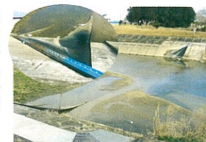
波瀬川のラバーダム

波瀬川のラバーダム改修に 耐用年数が迫っている高野井土地改良区内ラバーダムの改修に向け、国の予算獲得に努力します。