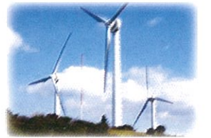
青山高原風力発電

榊原温泉・青山高原・高田本山・北島神社・亀ヶ広公園・八頭山・錫杖湖・マリーナ河芸・香良洲公園・経ヶ峯ハイキング・偕楽公園など津市の観光資源の充実とルートネット化をはかり、観光産業の育成、発展に努力します。